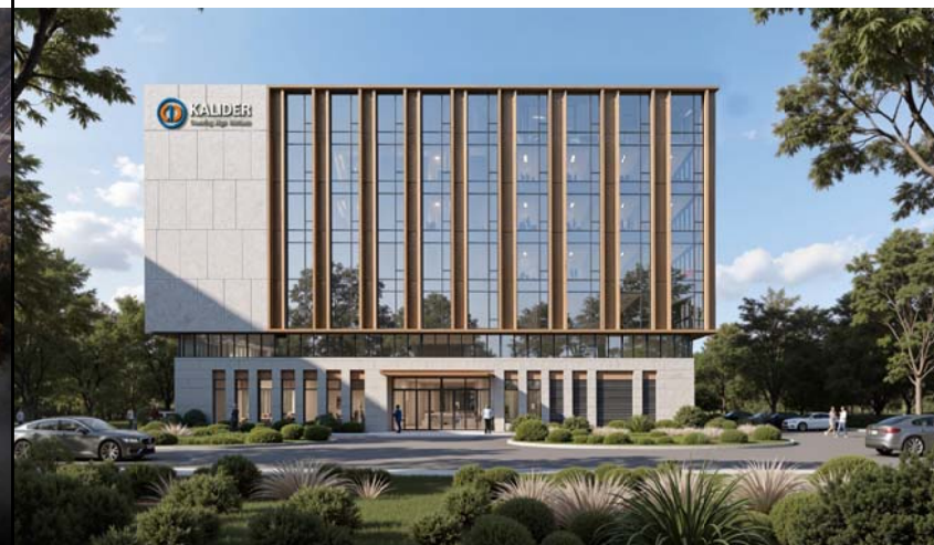
沿振石路效果图（仅为示意）