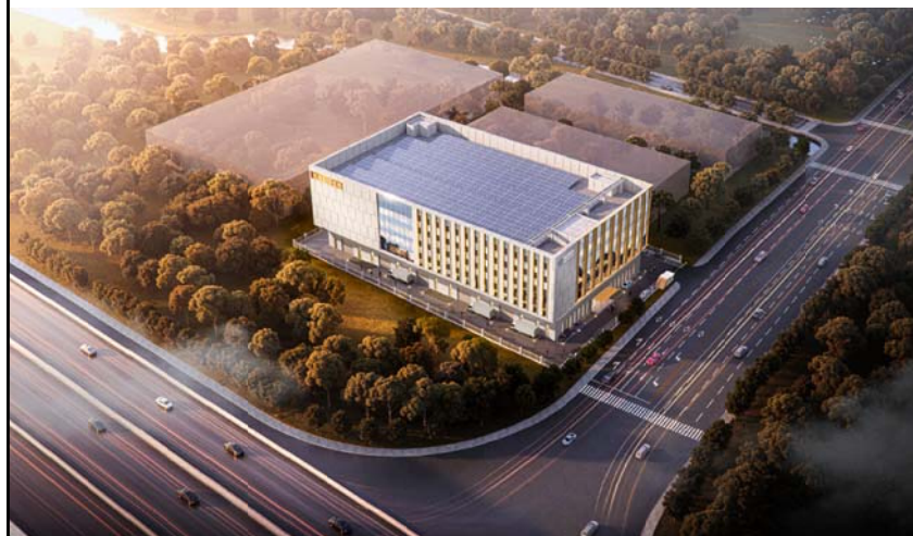
鸟瞰效果图（仅为示意）