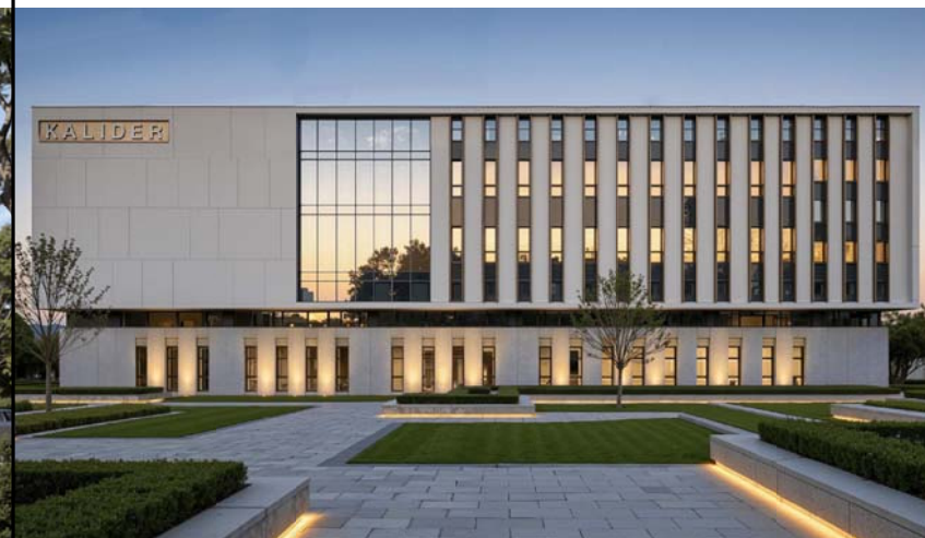
单体南侧效果图（仅为示意）