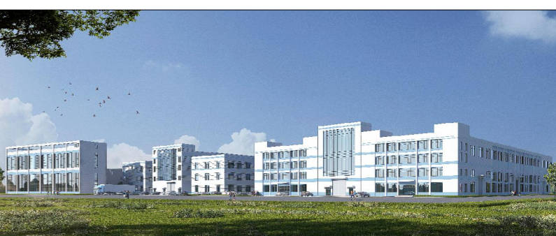
单体效果图 (仅为示意)