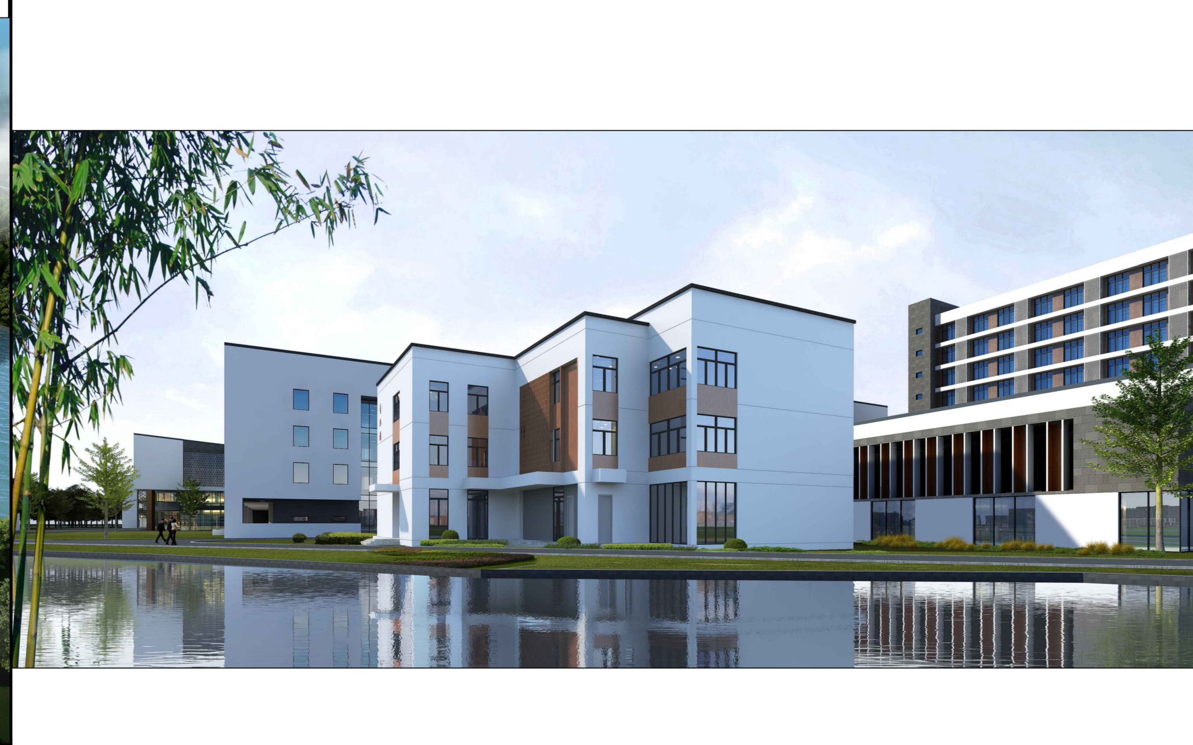
东南侧人视果图（仅为示意）