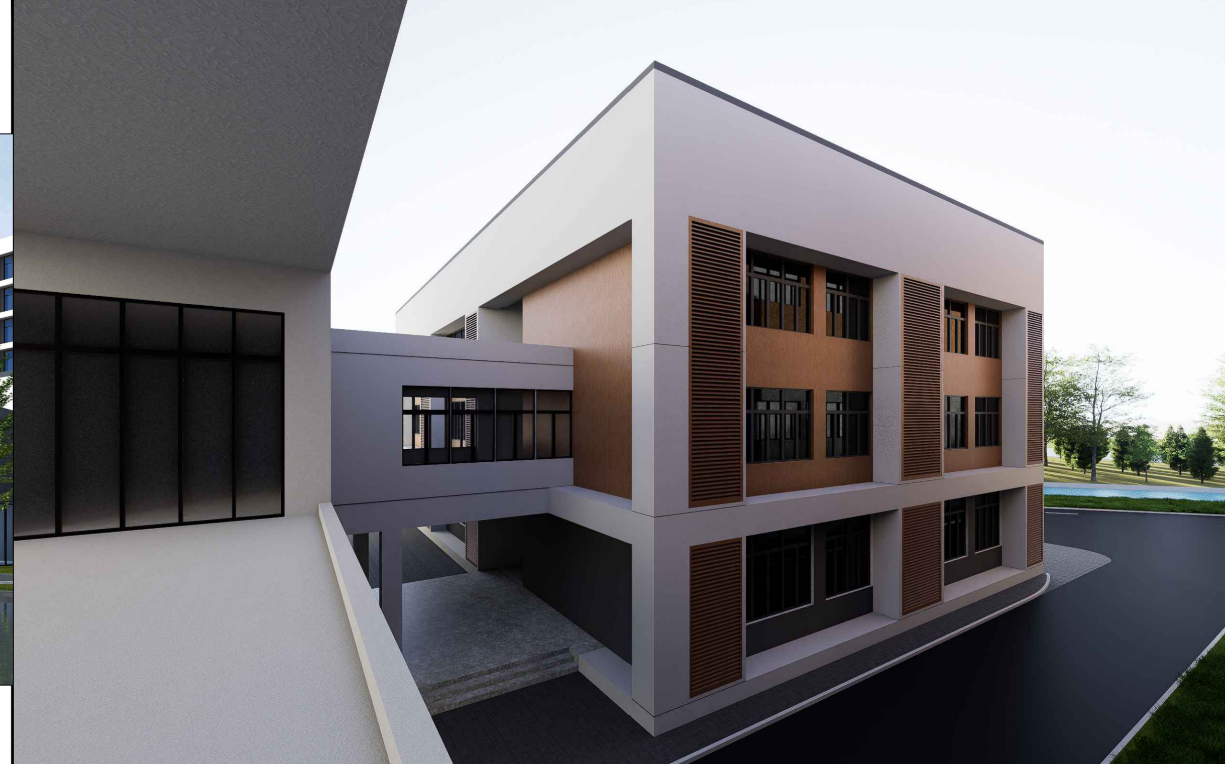
连廊处效果图（仅为示意）