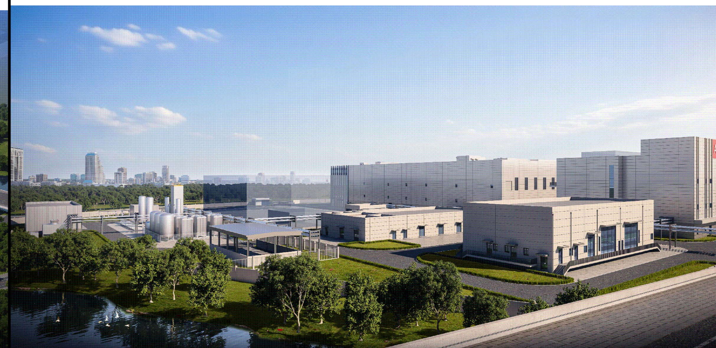
厂房单体效果图（仅为示意）