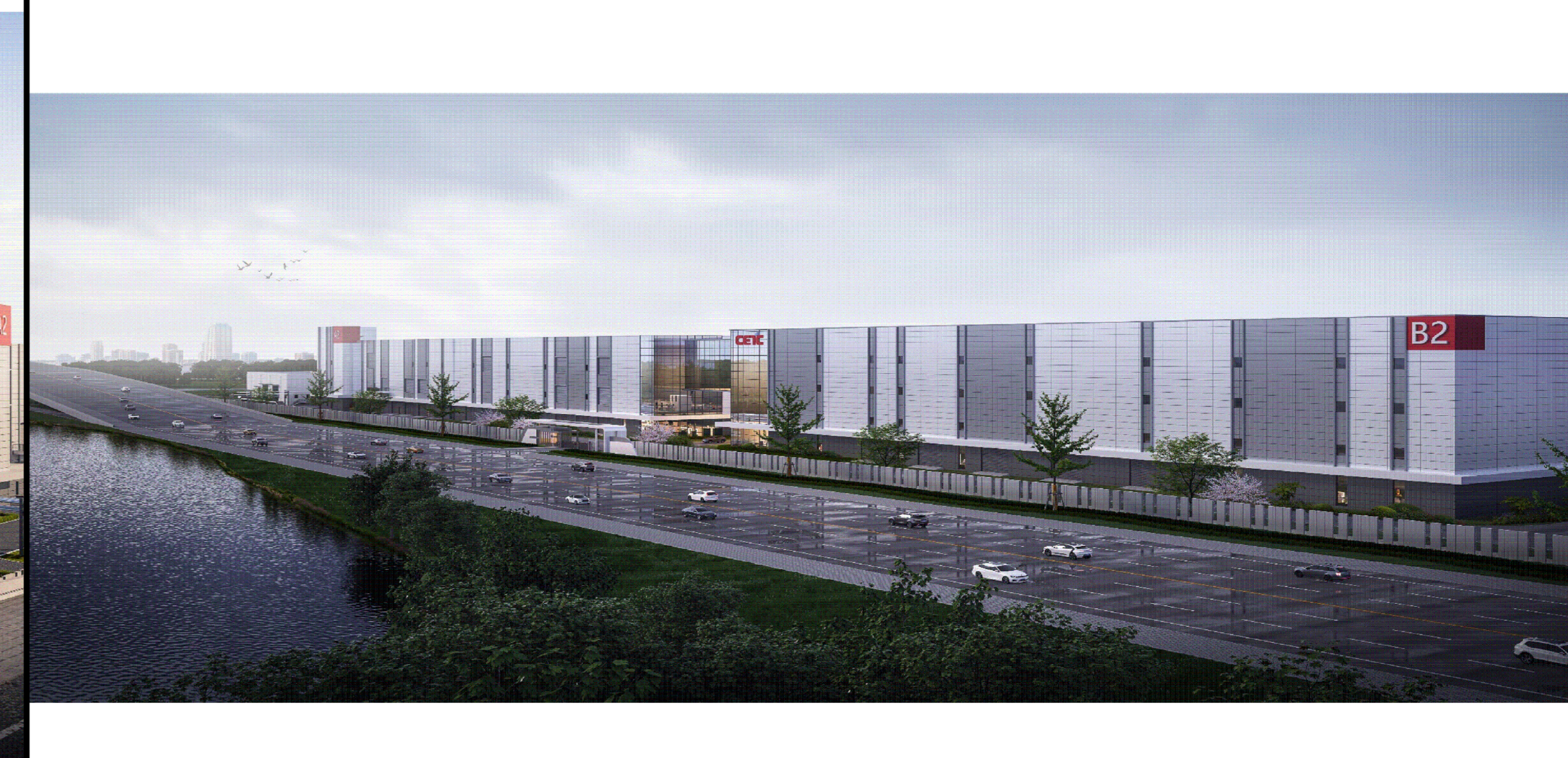
厂房单体效果图（仅为示意）