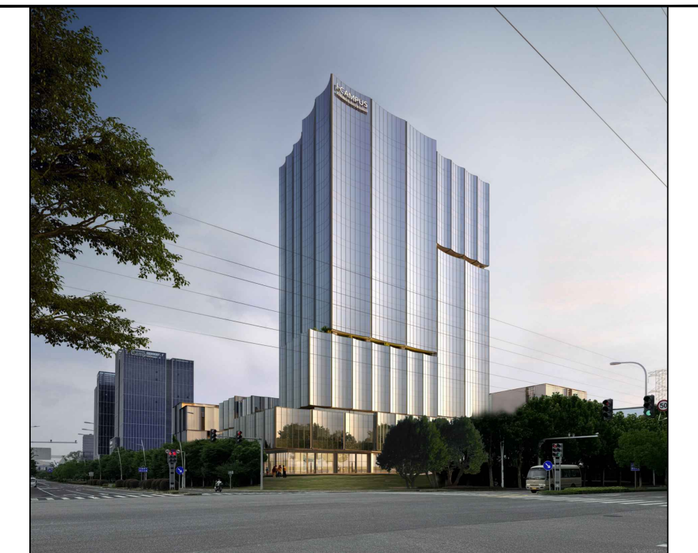
人视效果图（仅为示意）