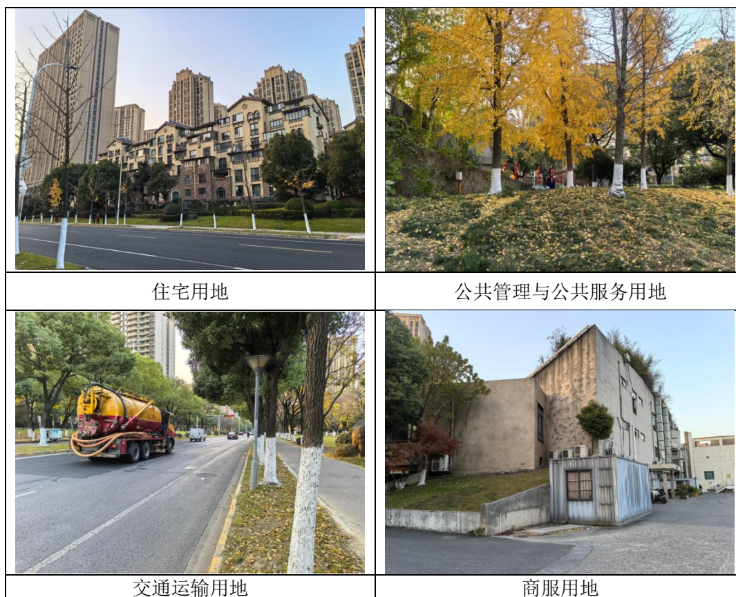
图 3-1 拟建线路沿线土地利用现状照片