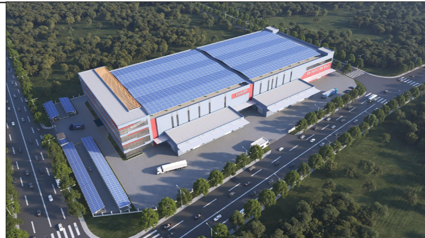
单体效果图(仅为示意)