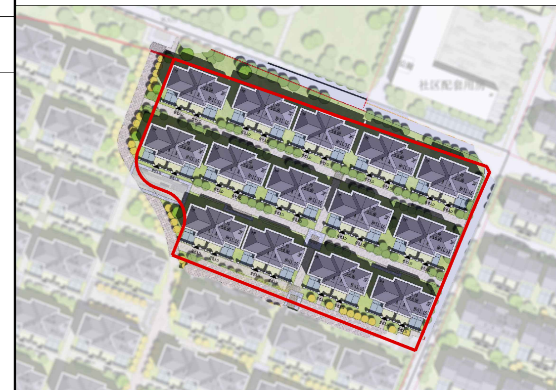
总平面图（仅为示意）