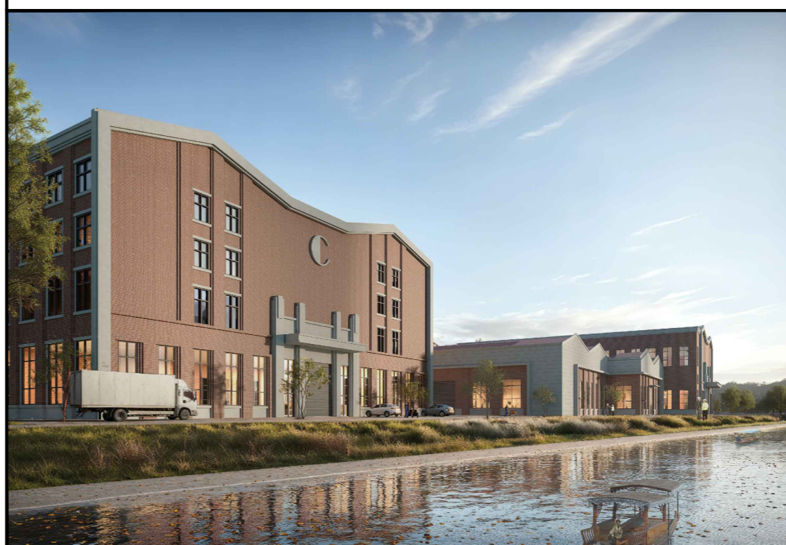
变更前单体效果图 (仅为示意)