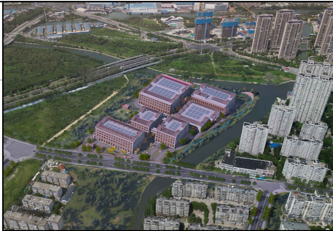
变更前鸟瞰图 (仅为示意)