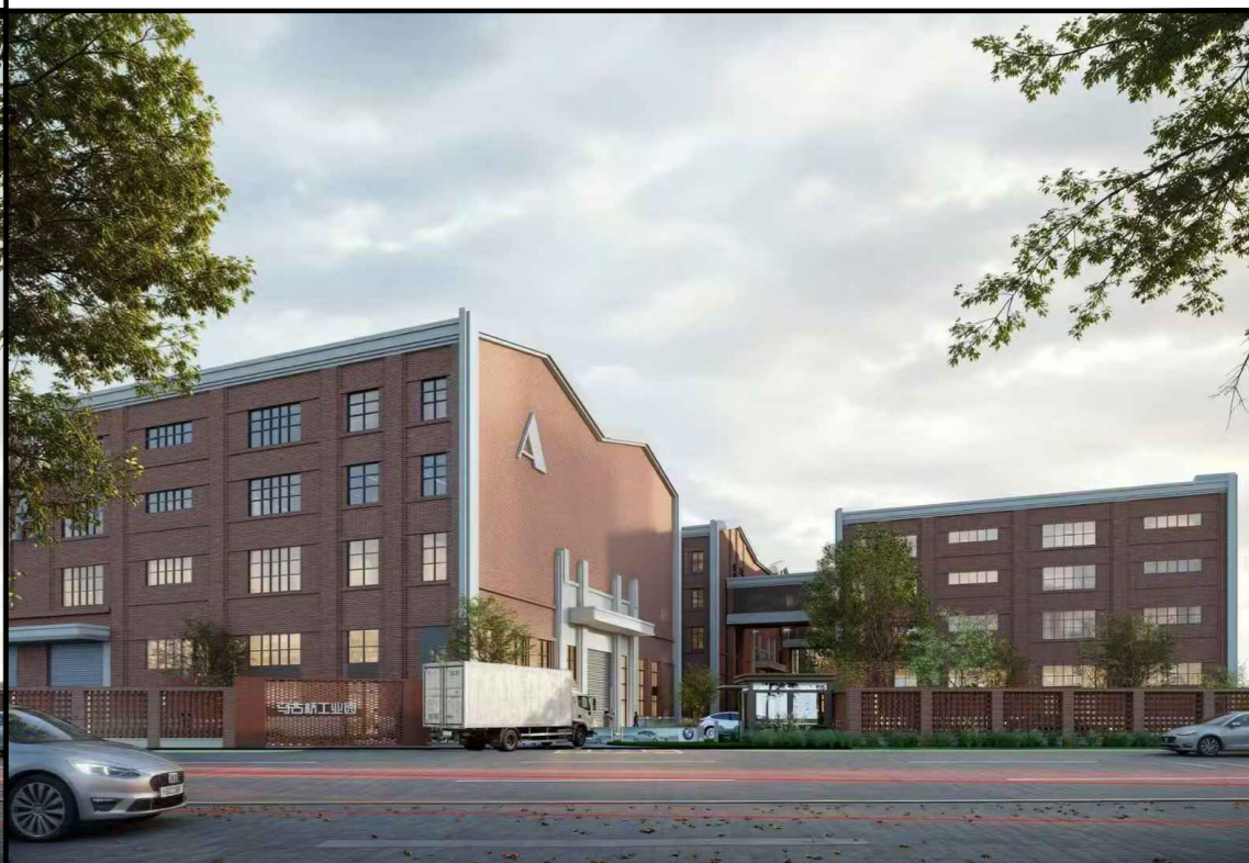
变更后单体效果图 (仅为示意)