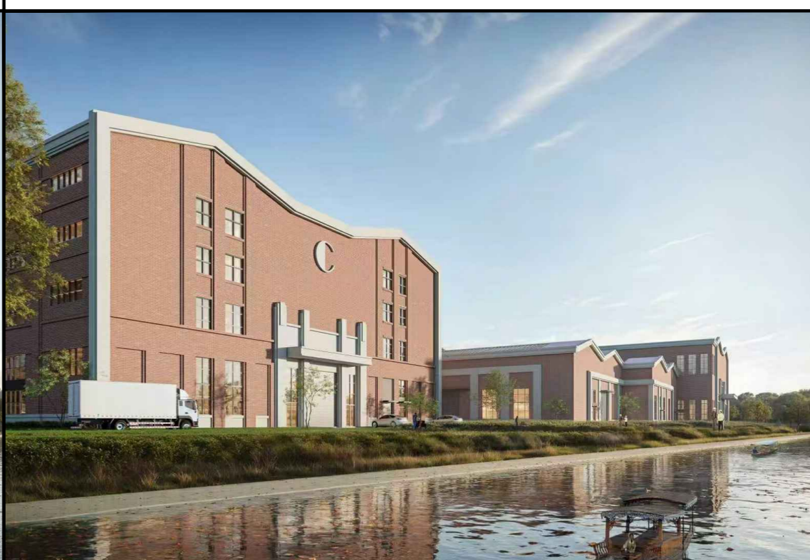
变更后单体效果图 (仅为示意)

根据城乡规划管理有关规定, 现对无锡市梁溪区广益街道广丰社区股份经济合作社“马古桥工业园升级改造项目(梁溪科技城马古桥智能制造产业园)”建设工程规划许可证进行变更批前公示。