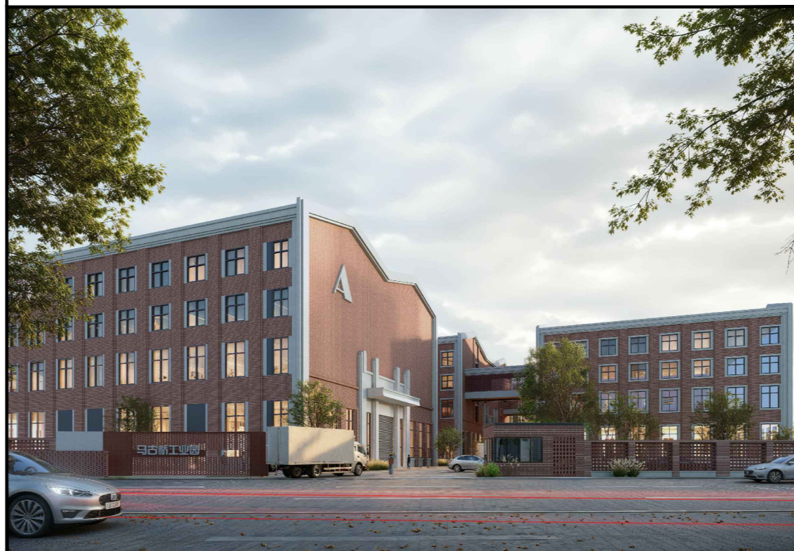
变更前单体效果图 (仅为示意)