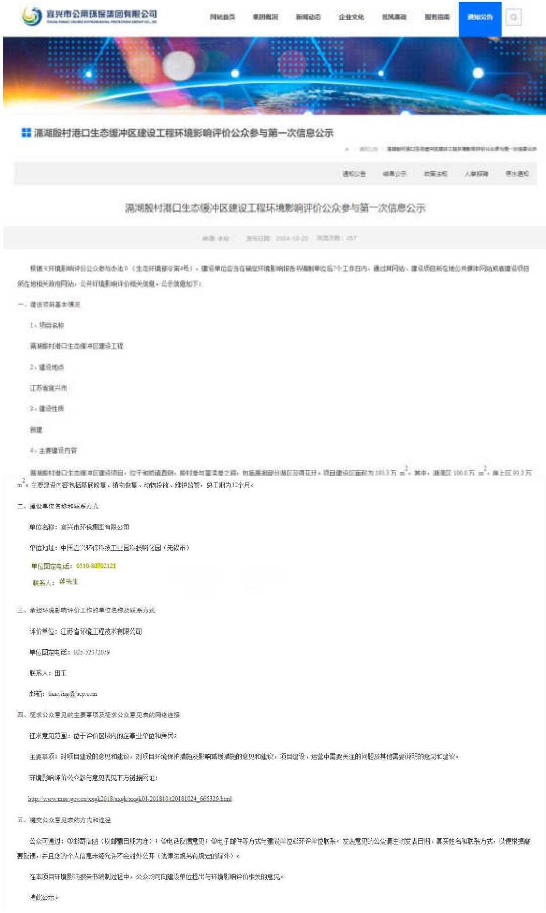
图 2.2-1 首次网络公示截图