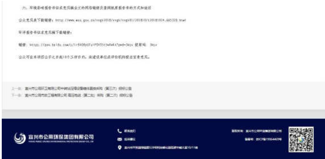
图 3.2-1 征求意见稿网络公示截图