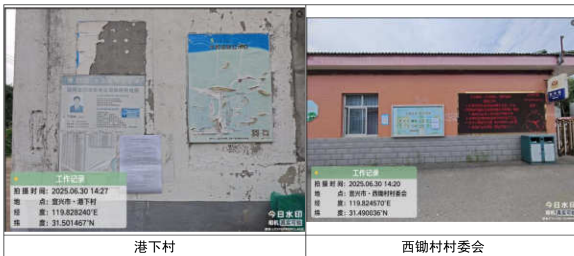
图 3.2-7 项目周边公示张贴照片