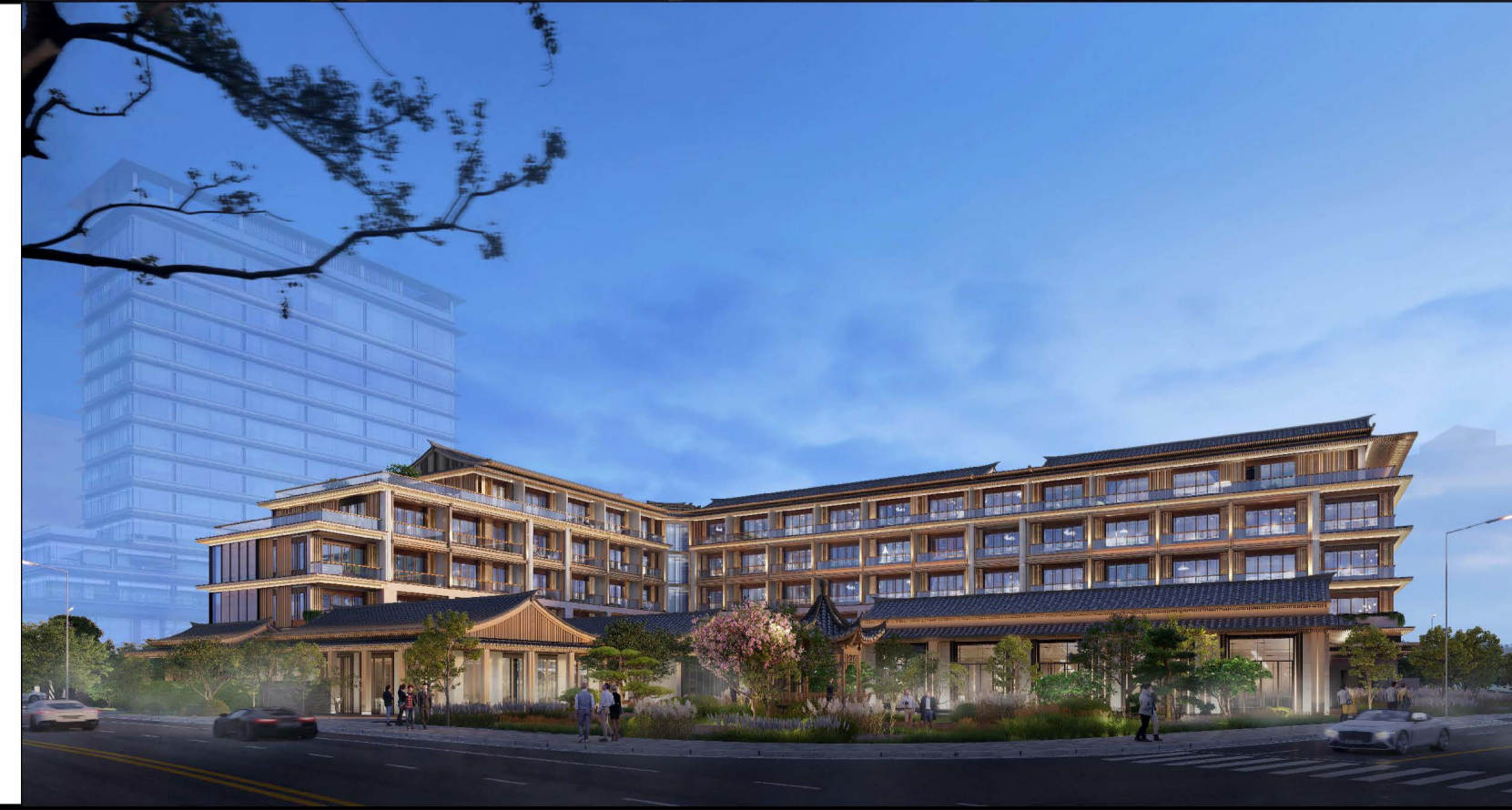
单体效果图 (仅为示意)