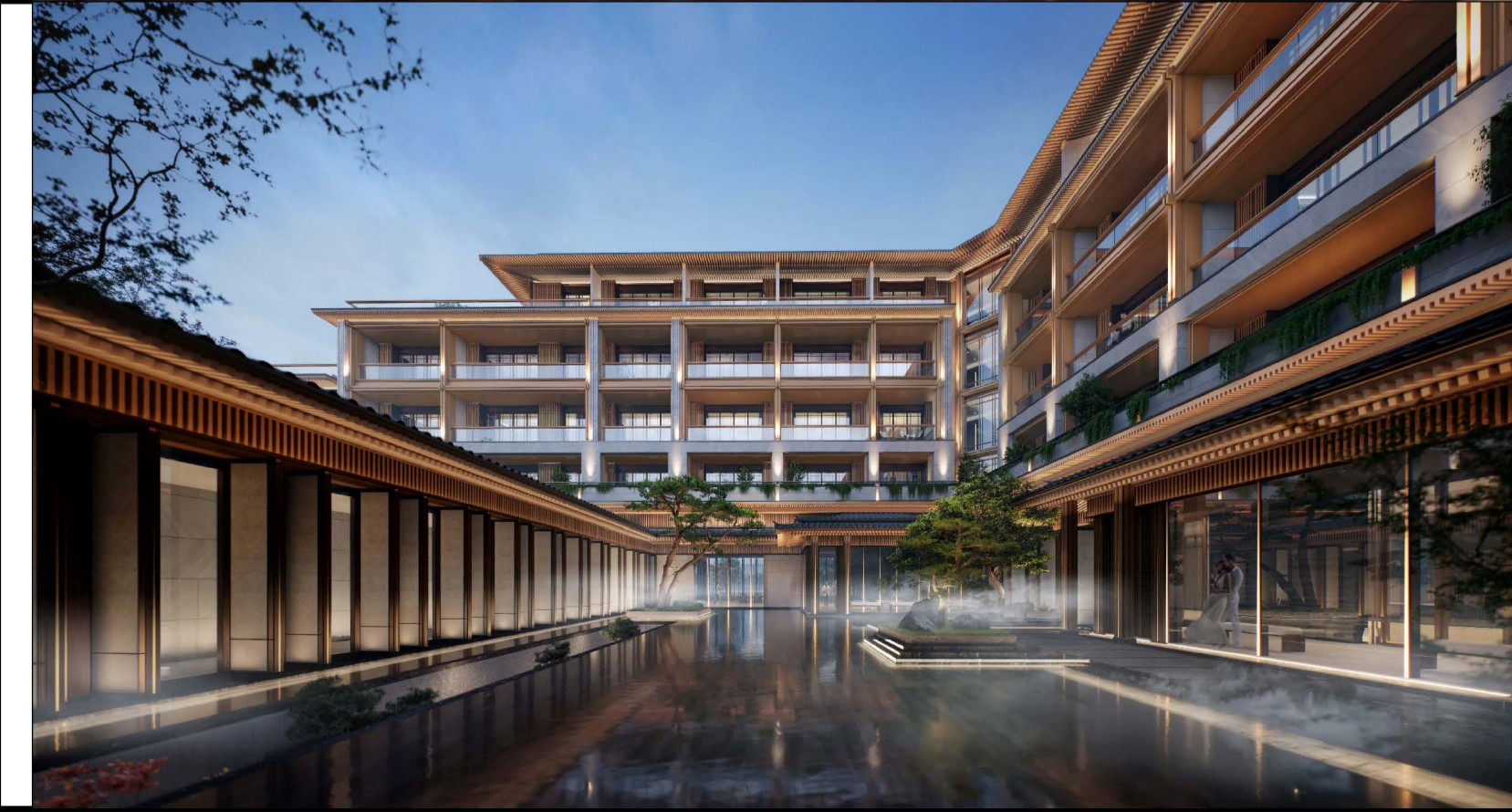
单体效果图 (仅为示意)