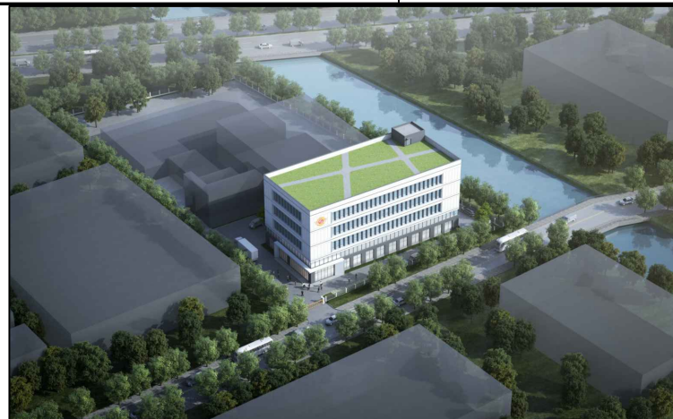
变更前（鸟瞰图仅为示意）