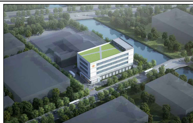
变更后（鸟瞰图仅为示意）