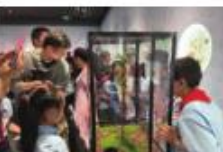
市民在瞻园参加主题活动，感受自然之美与文化底蕴。

“秋天是收获的季节，也是探索自然奇趣与传统文化的好时节。21日，由江南时报、新华报业传媒集团联合主办的‘到瞻园探索自然奇趣与传统文化’主题活动在瞻园举行。活动吸引了数百名市民参与，共同探索这座江南名园的自然之美与文化底蕴。” 活动现场，主办方设置了多个互动环节，包括自然知识问答、传统手工艺体验等。市民们不仅可以欣赏到园内的名木古树，还可以亲手制作传统工艺品，感受传统文化的魅力。 瞻园作为南京著名的古典园林，拥有丰富的自然景观和深厚的文化底蕴。此次主题活动旨在通过寓教于乐的方式，让市民更好地了解自然、热爱自然、保护自然，同时传承和弘扬中华优秀传统文化。